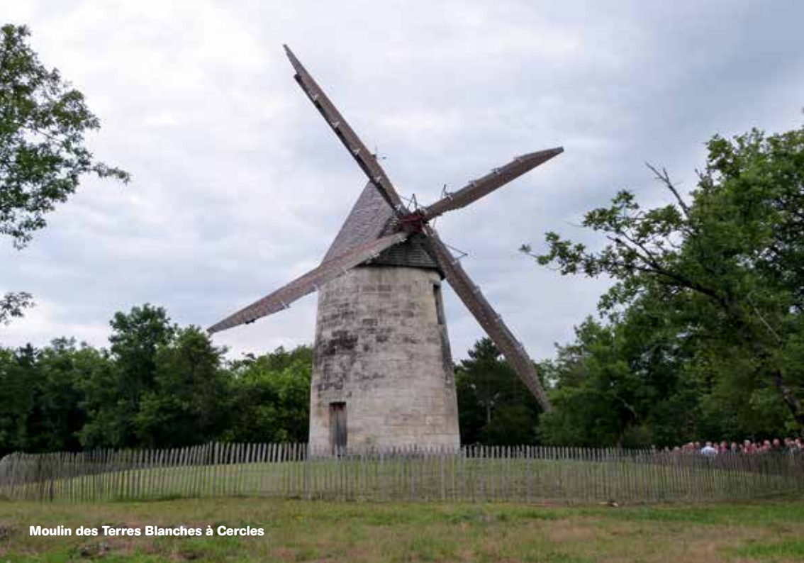
Moulin des Terres Blanches à Cercles